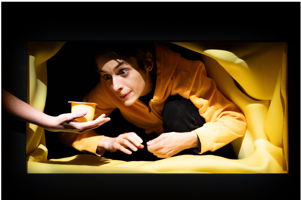
Festival Scènes d'Automne // Le CRÉA-Klingersheim / Alsace / Novembre 2023