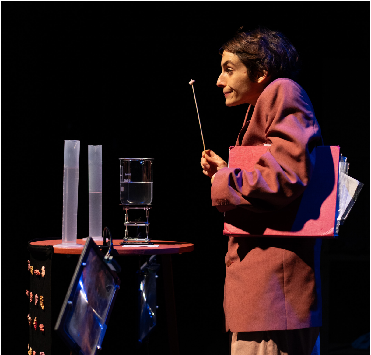
Espace Tival - CRÉA-KIngersheim / Alsace / Novembre 2023