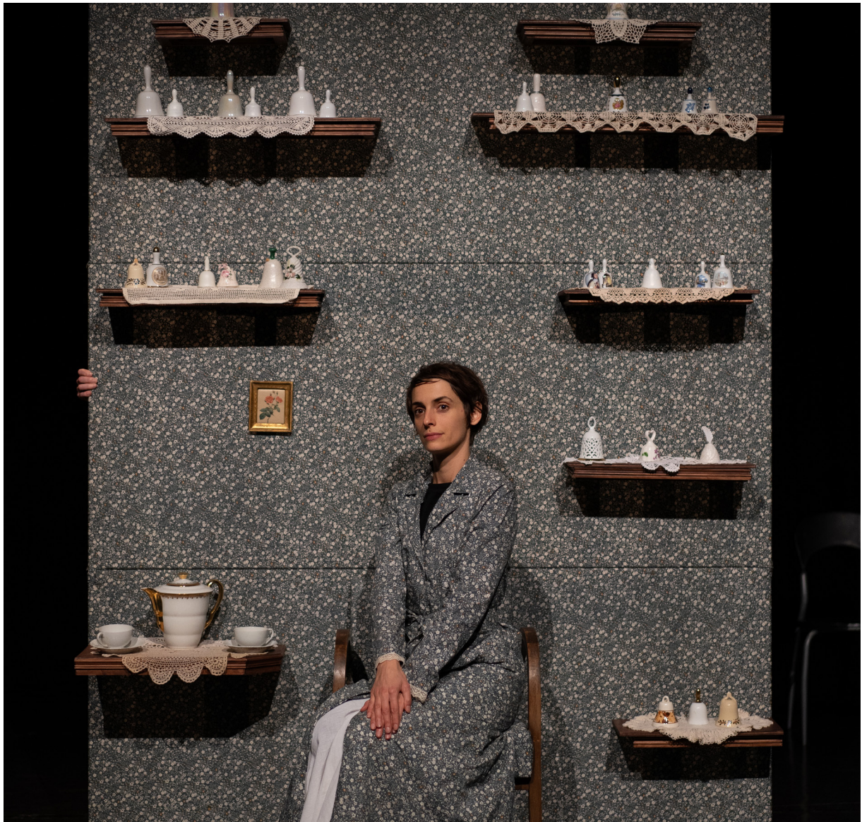
Théâtre au Mains Nues / Paris / Avril 2023