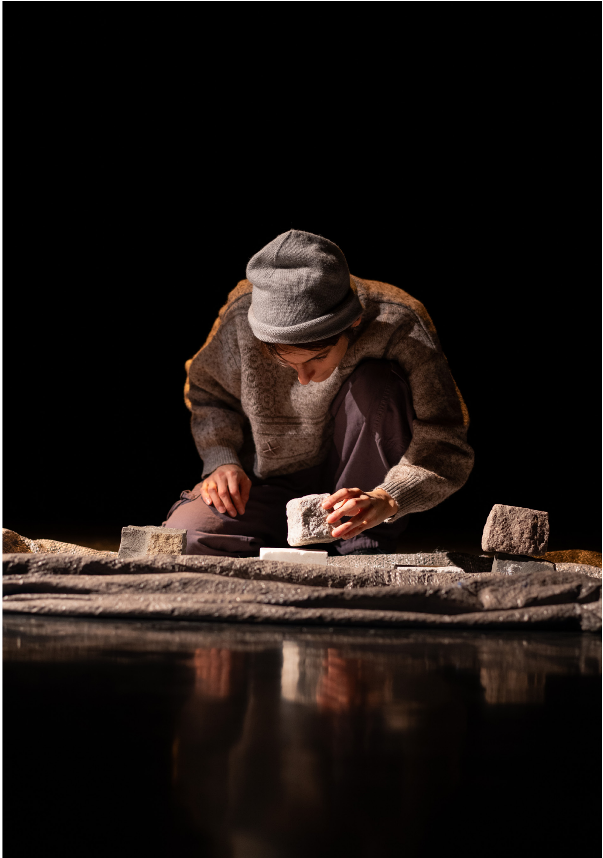
Festival Scènes d'Automne // Le CRÉA-Kingersheim / Alsace / Novembre 2023