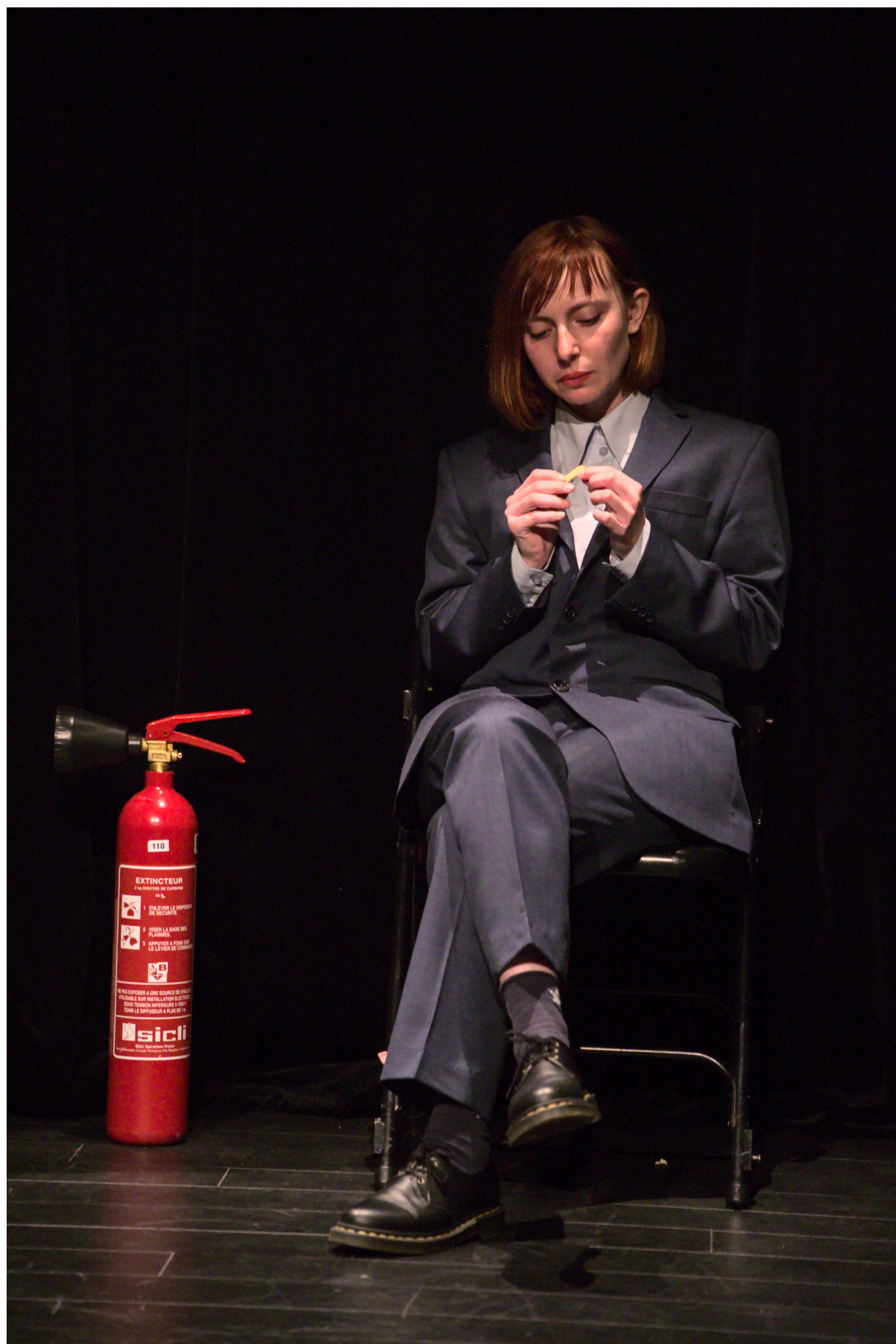
Théâtre au Mains Nues / Paris / Avril 2023